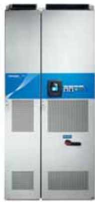
VACON® NXC шкафного типа с воздушным охлаждением