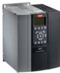
VLT® Lift Drive LD 302