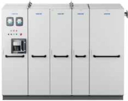
VACON® NXP шкафного типа с жидкостным охлаждением