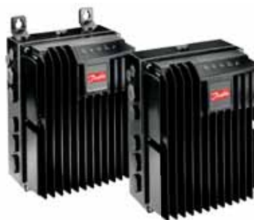
Децентрализованный привод VLT® FCD 300