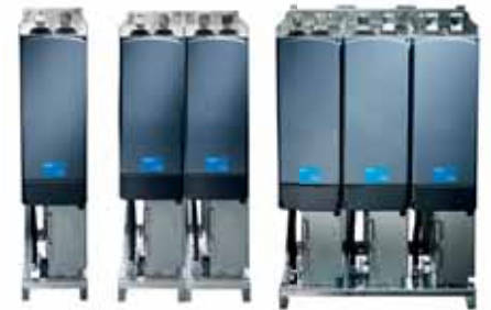
VACON® NXP Grid Converter