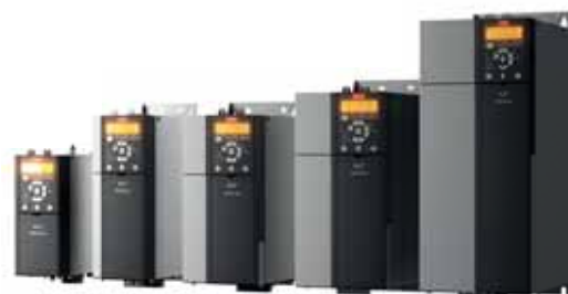
VLT® Midi Drive FC 280