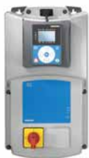
VACON® 20 X