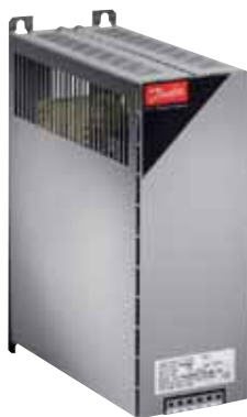
Фильтры VLT® du/dt