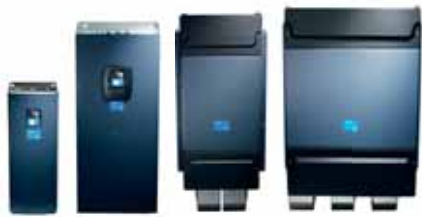
VACON® NXP Air Cooled