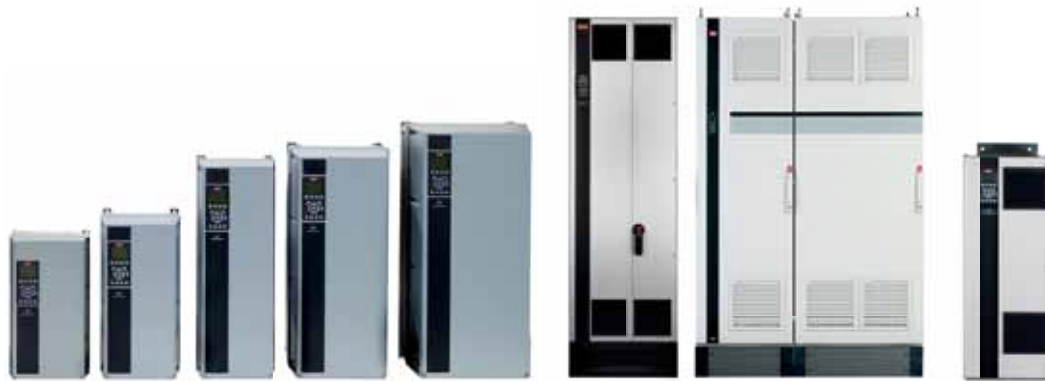
VLT® AutomationDrive FC 302, VLT® AQUA Drive FC 202 u VLT® HVAC Drive FC 102