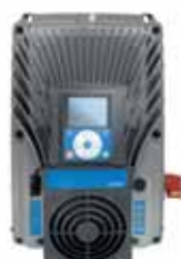
VACON® 100 X