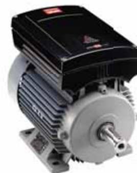
VLT® DriveMotor FCM 300