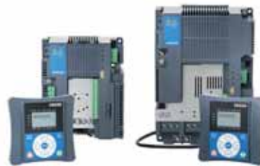
VACON® 20 Cold Plate