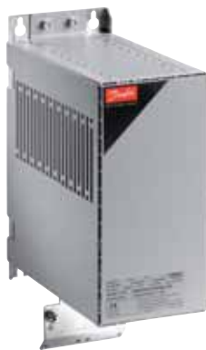
Синусоидальные фильтры VLT®