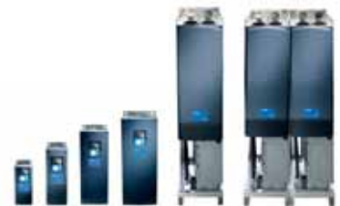
VACON® NXP с общей шиной постоянного тока