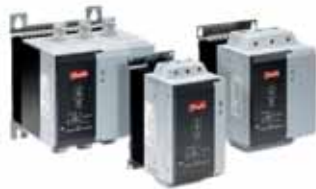
Устройство плавного пуска VLT® MCD 200