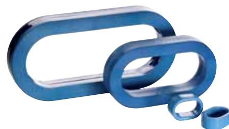
Фильтр синфазных помех VLT®