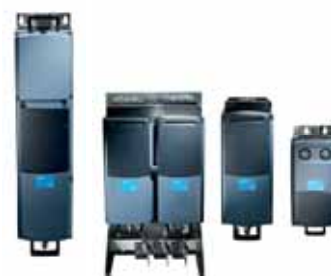
VACON® NXP с жидкостным охлаждением