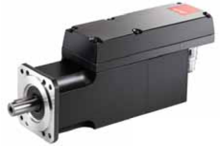
Интегрированный сервопривод VLT® ISD 510