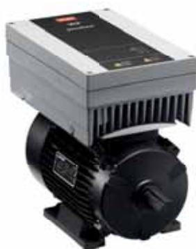
VLT® DriveMotor FCM 106