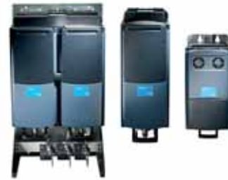
VACON® NXP Lc жидкостным охлаждением и общей шиной постоянного тока