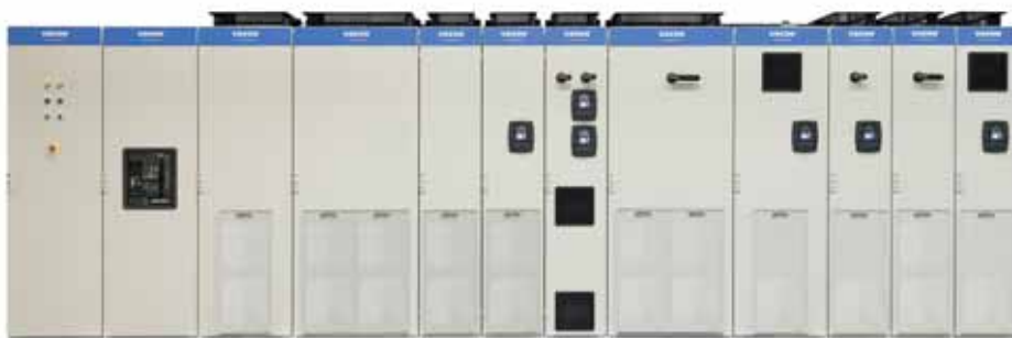
VACON® NXP System Drive