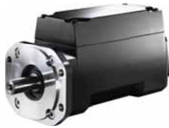
Интегрированный сервопривод VLT® ISD 410