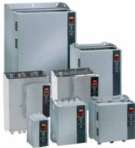
Устройство плавного пуска VLT® MCD 500