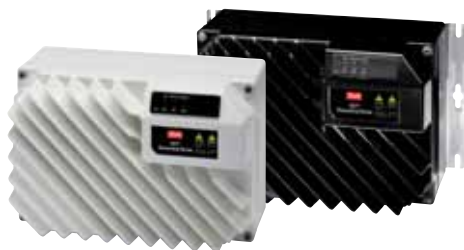
Децентрализованный привод VLT® FCD 302