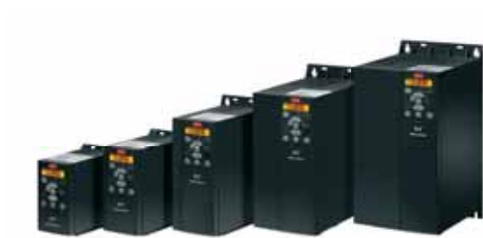
VLT® Micro Drive FC 51