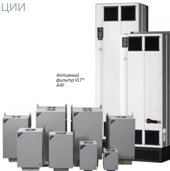
Активный фильтр VLT® AAF