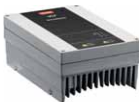
VLT® DriveMotor FCP 106