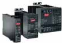
Устройство плавного пуска VLT® MCD 100